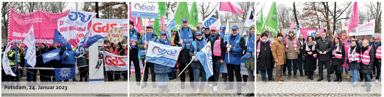
Potsdam, 24. Januar 2023